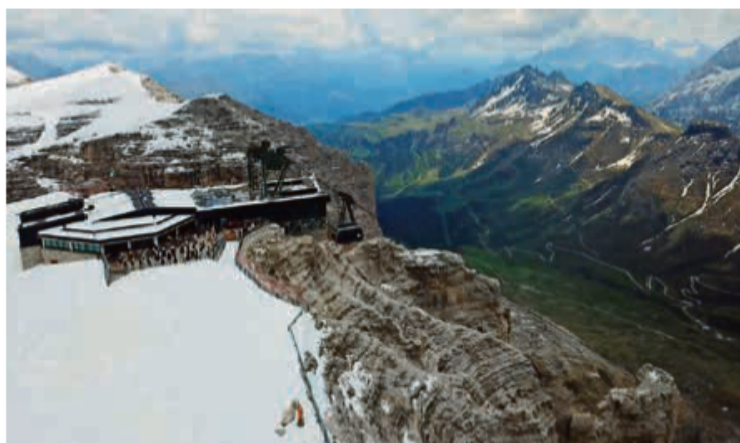
La Musega Auta Fascia à tegnù sie concert sun Sas Pordoì.

En sabeda ai 13 de jugn la Musega Auta Fascia à sonà sunsom al Sas Pordoì. N concert endrezà con la voa de pontèr via endodanef