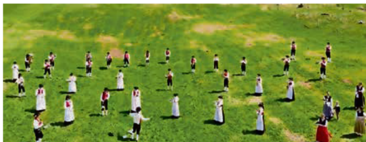
I museganc de la Musega de Poza te Val de Sèn Nicolò.