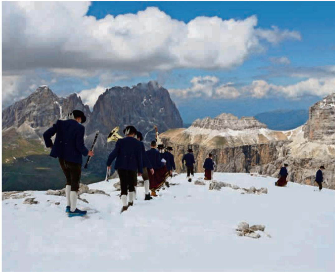
I sonadores de la Musega Auta Fascia à portà dant n concert sunsom Sas Pordoi, amò cori de neif.