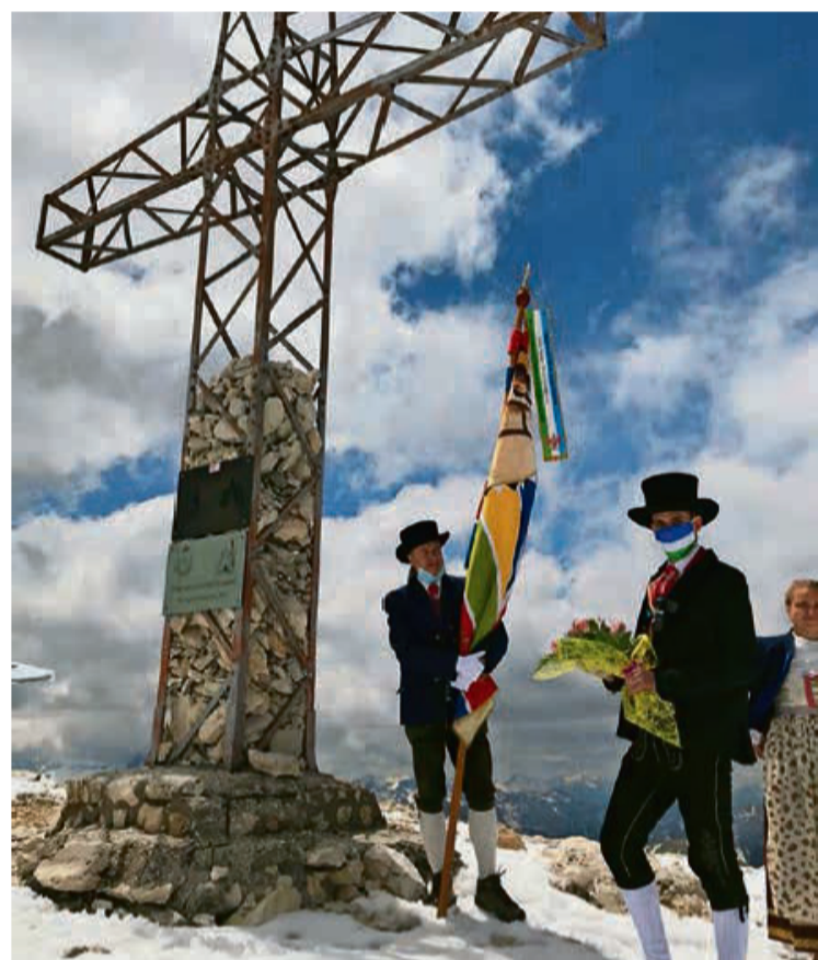
L conseier provinzièl ladin Luca Guglielmi à pojà n maz de fiores jai piesc de la crousc.