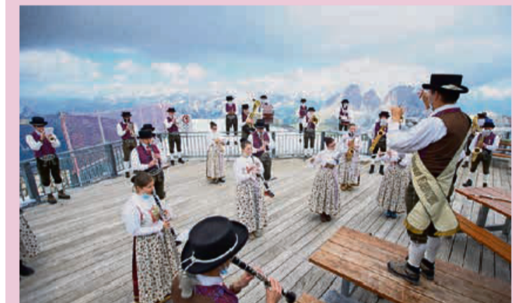
Na Musega leèda l'è stat l secret del suzess de la scomenzadiva.

L'è stat na gran endesfida, ma l'grop l'è a desmostrà propositif e engaissà: l'urrier l'è stat n muie empenatif, ajache l temp a la leta no l'era tant. Na Musega sci leèda l'è stat l secret del suzess. L zil de chesta proponeta l'è stat soraldut chel de ge stèr vejìn a la comunanza, de recordèr chi che à padì e ence chi che per prumes à scombatù chesta burta petorcena. Con chest segn, la Musega à volù ge dir n gran detelpai a duc i dotores, infermieres, socoridores e operadores sanitàres, chi che per prumes à metù sia vita en pericol e con sie sacrificie i à empeà na pruma lum de speranza tel scur de chesta setemènes.