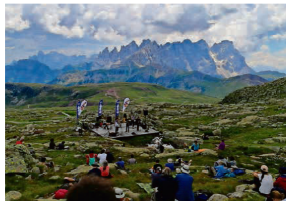
Momenc de la edizions passèdes del Fascia Panorama Music, te anter la Dolomites.