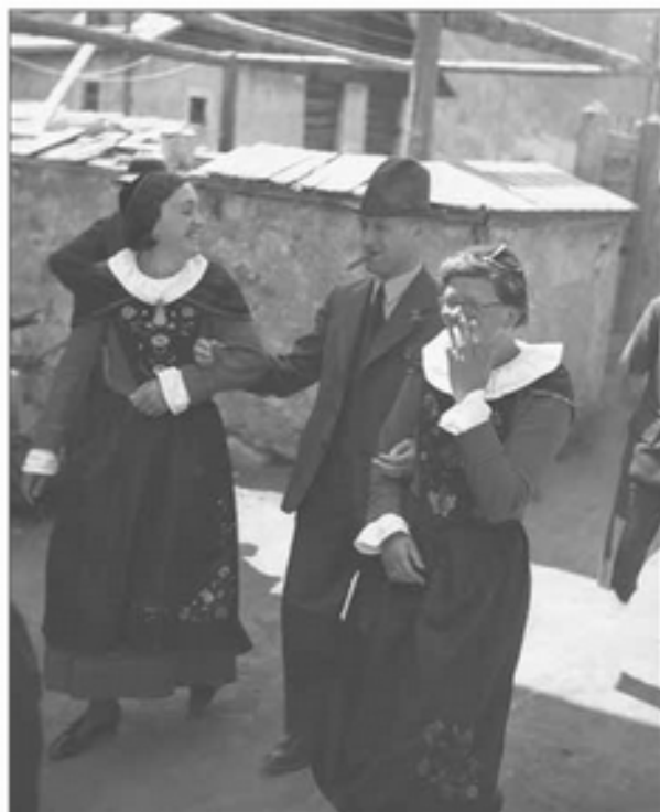
L minister Etter dl 1937 tl Grijon.