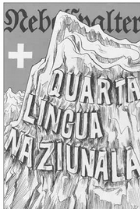
L foliet "Nebelspalter" dova de merz dl 1938 n segnal cler per l SCI, ziplan tl sas l messaje.