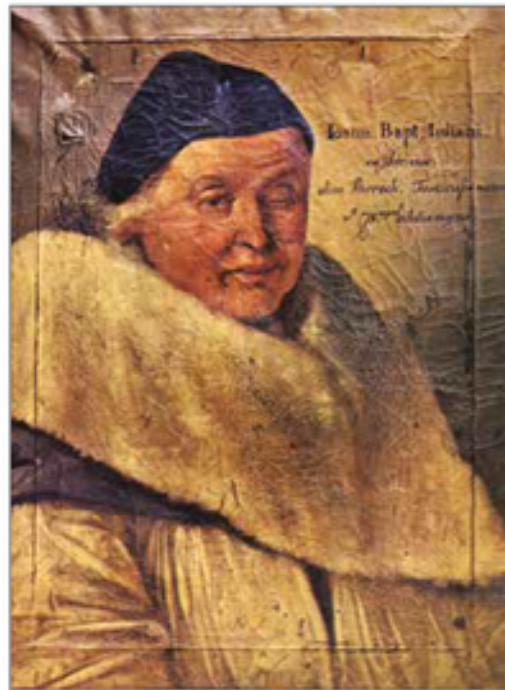
L canonich Jan Batista Giuliani, che del 1812 à lascia la pruma testimonianza de letradura fascèna.