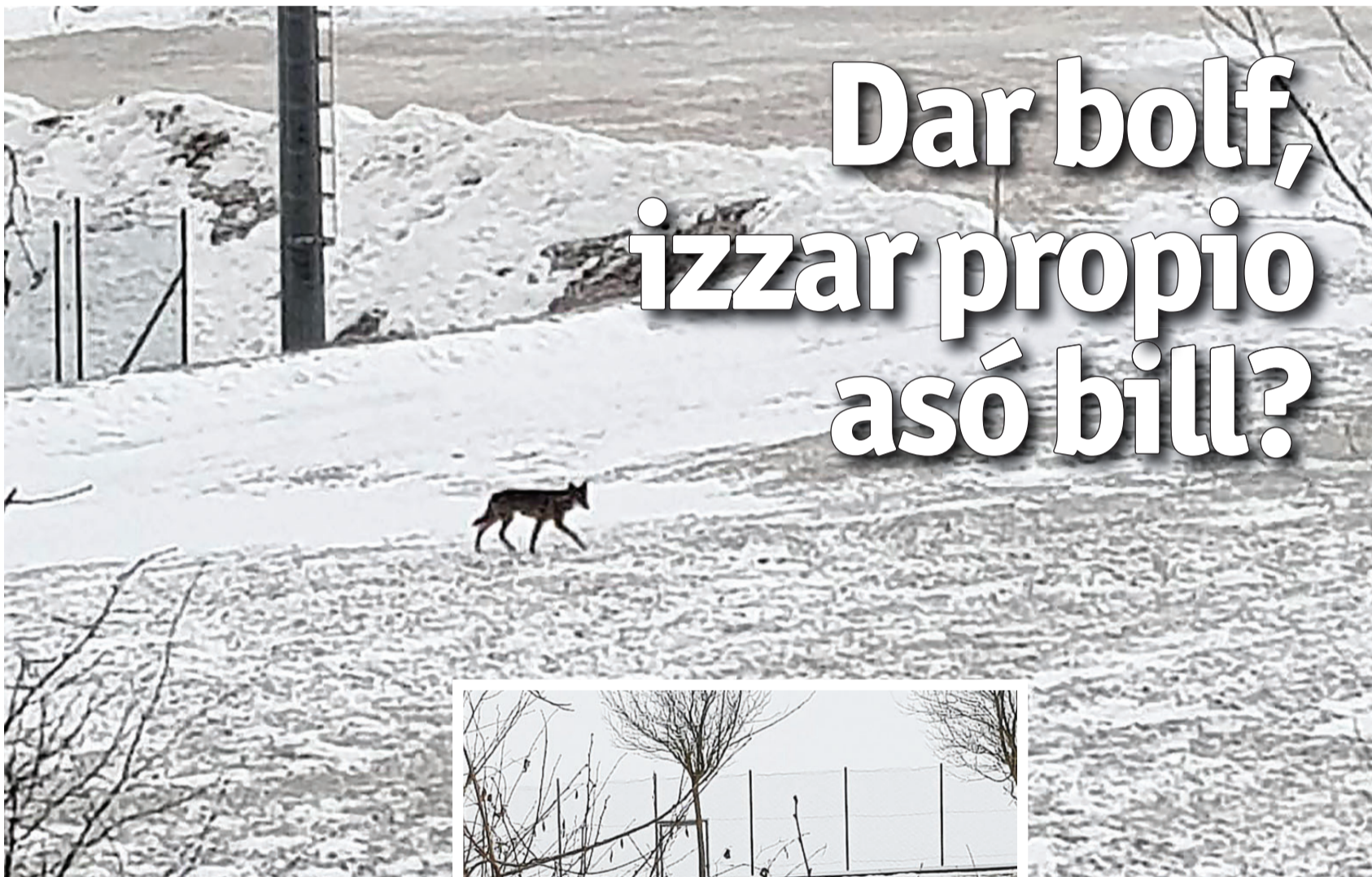
Sempre più frequenti gli avvistamenti dei lupi sull'Alpe Cimbra e sul vicino Altopiano di Asiago

Dar sèll von bolf afti ünsarn pèrng iz an argoment boda in dise lestrn mànat hattaz vil gemacht ren: disan summar, azzaraz gidenkht, dar bolf iz gerift afta ünsar hoachebene, an earstn 'inn in di Vesandar un hatt gemacht schade vrèzzante a par khüa un esldar vodar khesar von Frattn. Dena aparummaz hatten bokhennt odar fotografart da un danà ma ena zo machasan an kaso. Est però, daz earst von alln in di lestrn bochan, dar bolf – odar pezzar, di bölf, umbrómm sa soin romai vil – machanse seng hërta mearar. Ditza khint vür nètt lai in pa balt odar au pa pèrng ma tortimitt in haüsar o. Di boch pasàrt defatti ka Slege in di bisan nidar nà in bètlla, èkkhar un von Pènnar, hitar in ospedal, soinda khent gesekk zboa bölf, furse di gelaichegen boda soin pasàrt in di bisan un durch pa bege zuar Vesan a par tang darnà biane untar Kamporuf. Disan stroch an slegar boda iz gest sèmm hattze argenump pinn smartphone. An mita pasàrt anvetze an bolf alumma iz khent gesekk nidar nà in sportplatz vo