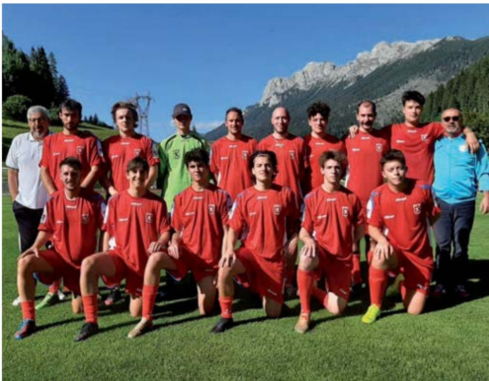
Da Zimbar Nazionale

Istituto Cimbro Kulturinstitut Lusérn Tel. 0464-78.96.45 info@kil.lusern.it www.istitutocimbro.it