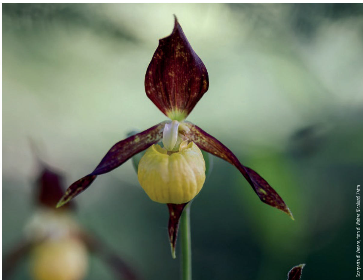
Scarpatta di Venere, foto di Walter Nicolussi Zatta