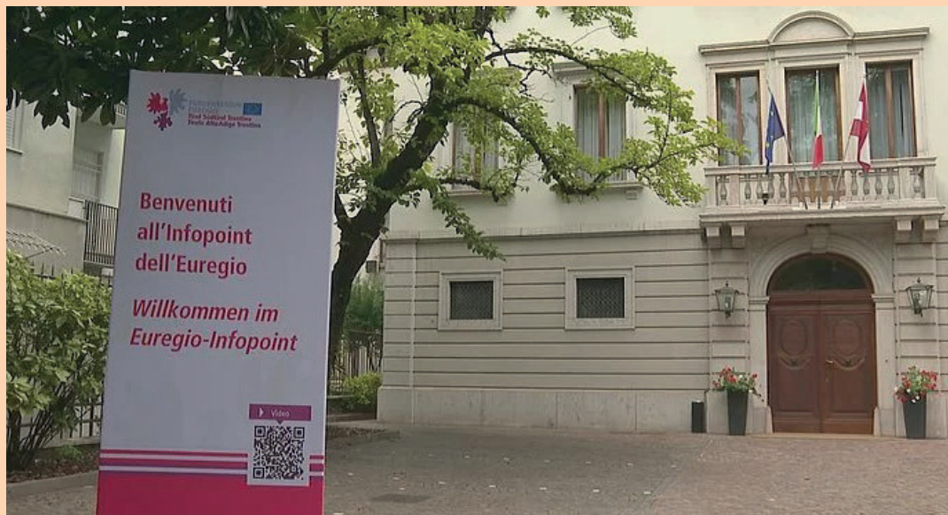
lettratt va de sait euregio.info/it

De eirtecher van Euregio sai' an rai van trèffen ver za klòffen va social ont kultural temen as de inser euroregion. De hòltn se ka Trea't en haus Moggioli ont de sai' offet en òlla de lait.