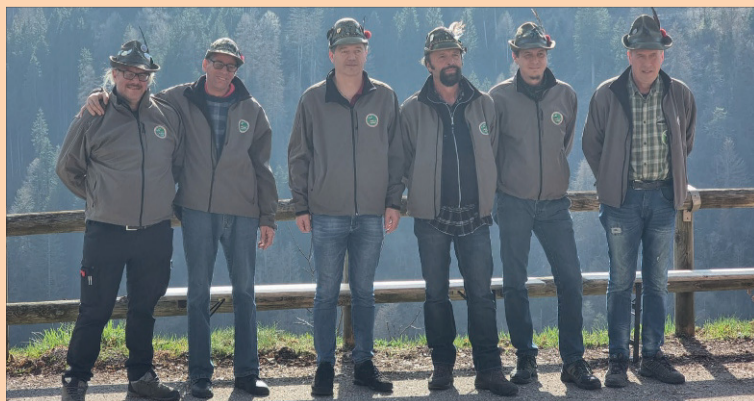
Il Gruppo alpini di Frassilongo - Roveda, che ha contribuito ad organizzare l'evento

i vigili del fuoco volontari, il gruppo giovani... Levento ha richiamato, oltre ai paesani, anche qualche persona dai comuni limitrofi, che ha voluto partecipare al momento di convivialità. La ricorrenza annuale, che doveva essere in gennaio secondo quanto prevede il calendario liturgico, è stata spostata di comune accordo per consentire la piena ripresa in salute del parroco. A seguire, il Gruppo alpini di Frassilongo - Roveda ha organizzato un rinfresco, allestendo tavolate e panche, portando thè, vin brulè e altre bibite. Il punto di rinfresco si è arricchito dei dolci preparati e offerti dai paesani stessi.