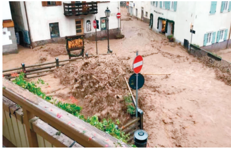
Nel pomeriggio dello scorso 3 luglio gran parte del Trentino è stato interessata da eccezionali piogge. Particolarmente colpiti la bassa valle di Fassa e l'abitato di Moena (nella foto)