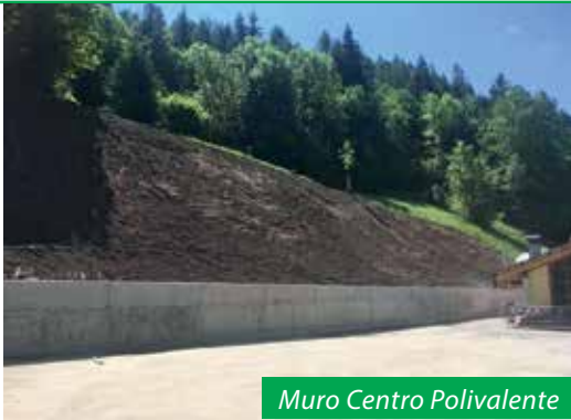
Muro Centro Polivalente