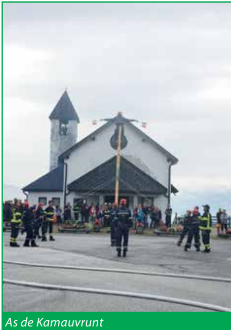
As de Kamauvrunt

Per concludere un grazie di cuore a tutti con un sincero augurio di Buon Natale e felice Anno Nuovo da parte di tutti i vostri pompieri.