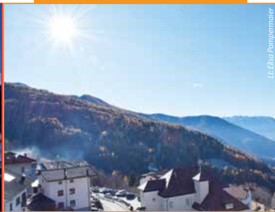
Lt. Elica Pompermaier