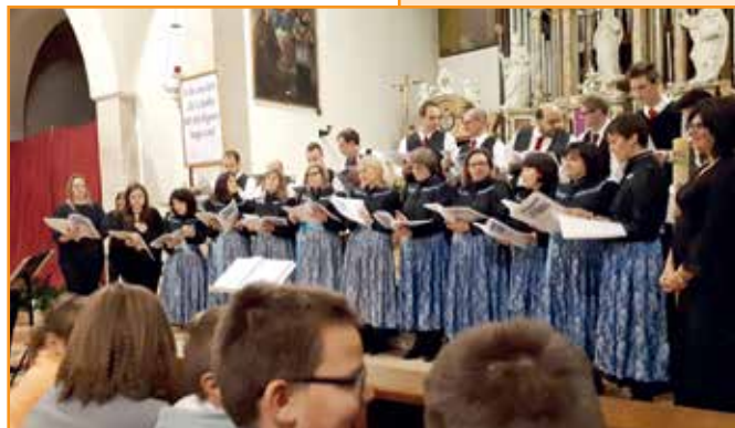
En konzert ka Albiano (22.12.2018)