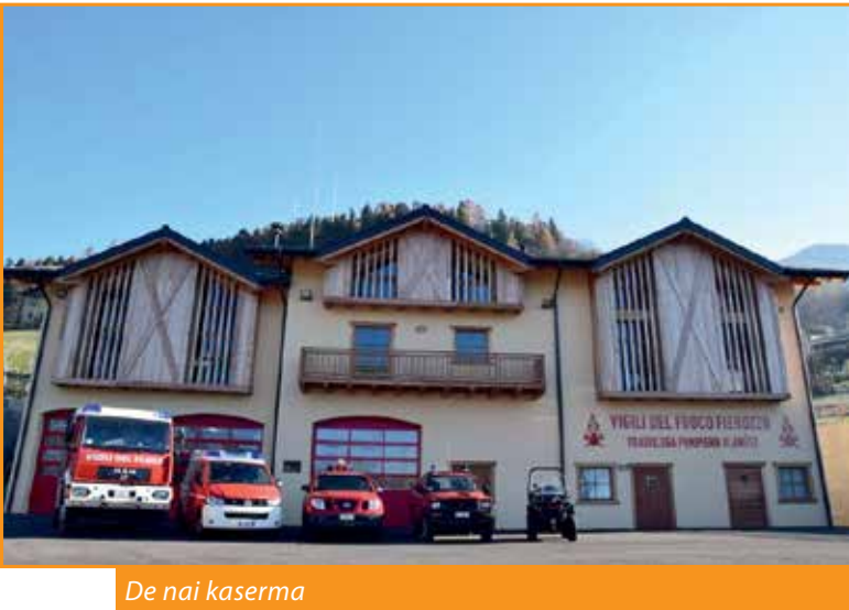
De nai kaserma