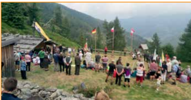
Ka de Feldkappelle, heibeger 2019