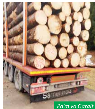
Pa'm va Garait