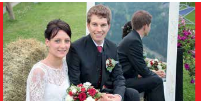
Òlls s peiste ver de inser tonzer ont gaiger Martin ont Manuela!