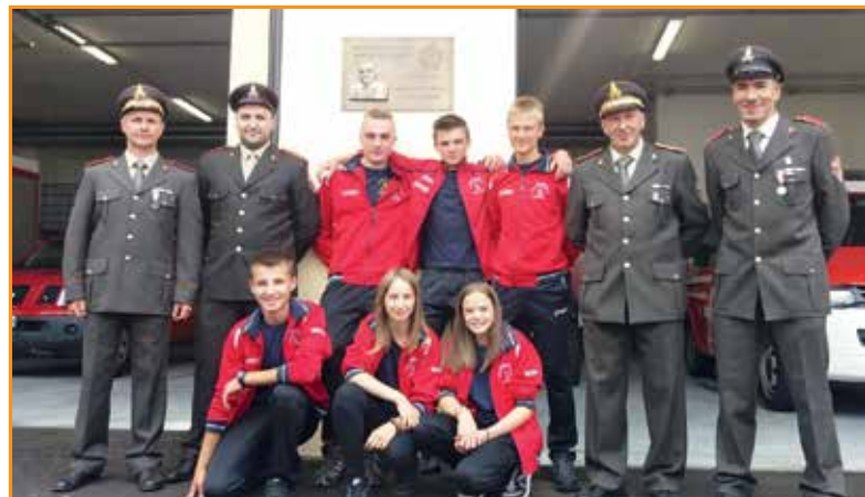
De pompiarn pet de allievi