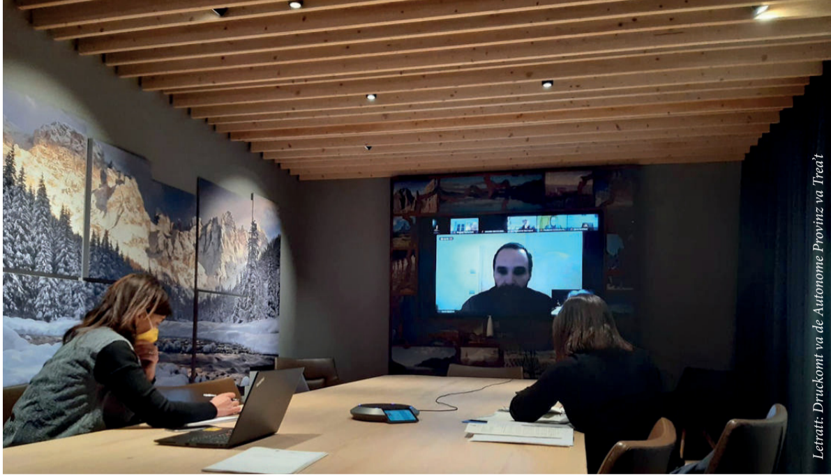
Lettratt: Druckomt va de Autonome Provinz va Trea't

realizzazione di materiali didattici, di video-produzioni, di banche dati, costruzione di reti con altre minoranze linguistiche, innovazione tecnologica o organizzazione di concorsi letterari.