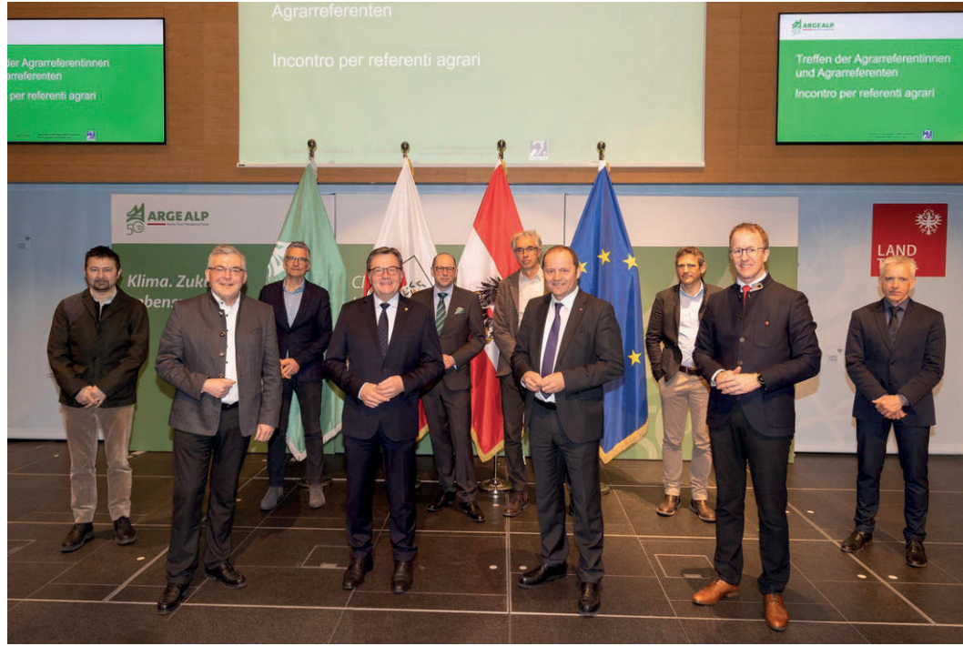
De toalnemern derbail en trèff ka Innsbruck