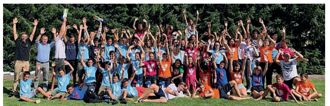
EuregioSummerCamp 2019