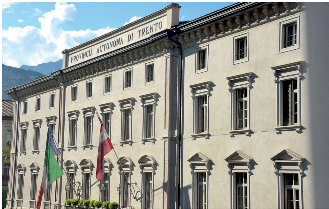
Letrat druckomt PAT

De provinzaljunta ist no za vourstelln an tèckst va gasetz as bill vernaiern de Tolgamoaschòftn. Der asesor Mattia Gottardi hòt gem de earstn informazionen en de junta van Lokalautonomirot. Der bichteste punkt ist as de Tolgamoaschòftn barn nèt kemmen sperrt, abia as ist kemmen tsbunnen en de leistn jarder. De barn kemmen vernaiert ont pfiart va de Konferenz van pirgermoastern; dena, de barn gea' envire pet de sai' na kompetenz va vour. Der president van an iata Tolgamoaschòft bart sai' oa'n van pirgermoastern van gamoa'n as kearn en si. Asou, der president bart neamer sai' an òllgamoaschòft ònderst van mittoaln van orgl. Der Rot va gamoa'schòft ont der Zòmmriaf va gamoa'schòft barn verschbintn.