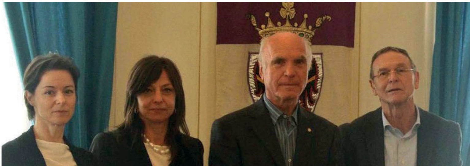
De Autoritet en 2014, garo u'pfònk de earstn tritt

De Relazion ist der leiste tritt ver de Autoritet as rift de sai' òrbet en moi