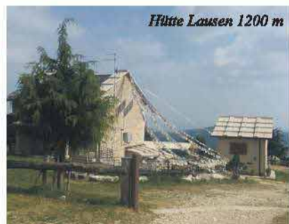
Hütte Lausen 1200 m

roate platt. Sidar hërta di arkitetura von haüsar von pèrng iz khent genump zo hentn peng in klima. An ándra bèlt iz gest balda di laüt zoa zo spara un furse zo helvase anándar hám ágehenk di haüsar. Auz ná in rukknplam vo disarn hoachebene, nidar un au von teldar un vadju di haüsar soinn asó gebortet azpe kontráda auz ná in beng, ummaz