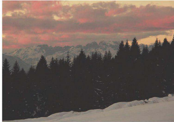
Dar bintar attn Kãmp

Disan bintar hatz lai gesnibet a bòtta un bianc nìcht. Häüt di Boinichtn soìn gest ãna snea un vor a par djar, hatz gerenk durchauz, tage un nacht. Dar snea iz az bi a barmã dekh un sèmm untar allz schlãft