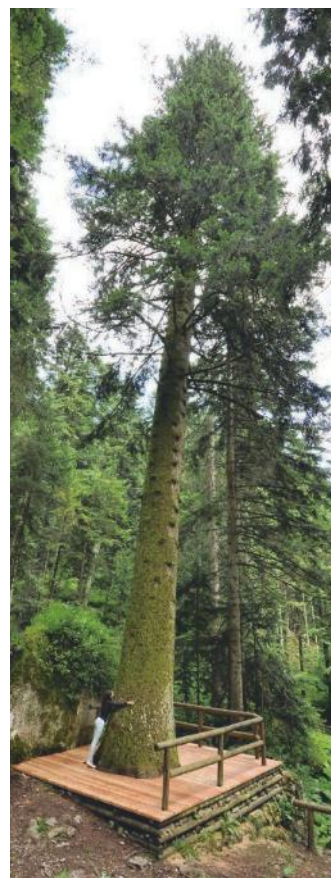
L'Avéz del Prinzep

E siste nel nostro continente un catalogo di alberi monumentali - l'European Trees - che, assieme al disciplinare forestale nazionale, tutela e preserva questi giganti della montagna. Nella lista, al primo posto, si trova il famoso Pez del Prinzep che con i suoi cinquantaquattro metri di altezza, sei di circonferenza e duecentotrenta anni di vita ben portati, si aggiudica il primato di abete bianco più alto d'Europa. Boaztarz ke in Europa izta a dokument bodá haltet gezelt alle di èlbar von lentar, daz earst von alln di eltarstn un höacharstn? Daz schümna iz ke sidar biane zait a tánn vodar Zimbar Hoachebene iz vürpasárt alln un iz gerift finn in earst platz: 'z iz dar "Pez del Prinzep", di tánn boda iz nidar a Malga Laghetto, nâmp dar hülbe. Di tánn iz hoach viarunvürtzkeh mètre, bait schiar sèkhse un hatt opp un zua zboahundartundraizkeh djar. Vor biane zait dar "Pez del Prinzep" izzese darkrânkh: di vichele von balt hám ágiheft zo vrèzzanen di burtzan un di tánn hatt ágiheft zo darvaula. Di forestél però hám lai gearnt ke eppaz iz gest no zo sutzédra un alóra hámsa ágeheft z'arbatada drá machante au a gâbia gántz umminüm zoa azta di vichar