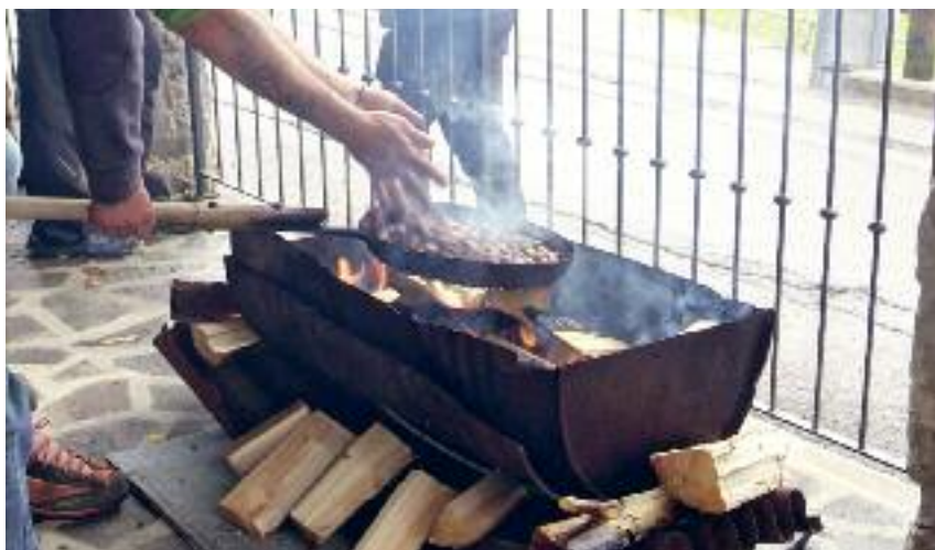
Castagne di Ognissanti

Da sempre Luserna è contraddistinta da svariate associazioni di volontariato che hanno reso possibile uno spirito di mantenimento, tutela, unità e aiuto reciproco, molte delle quali di essenziale importanza. Pensiamo ai Vigili del Fuoco Volontari – Pompiarn vo Lusérn – sempre attivi e reperibili 24 ore su 24. Pensiamo al pronto intervento 118 che sempre ci ha offer-