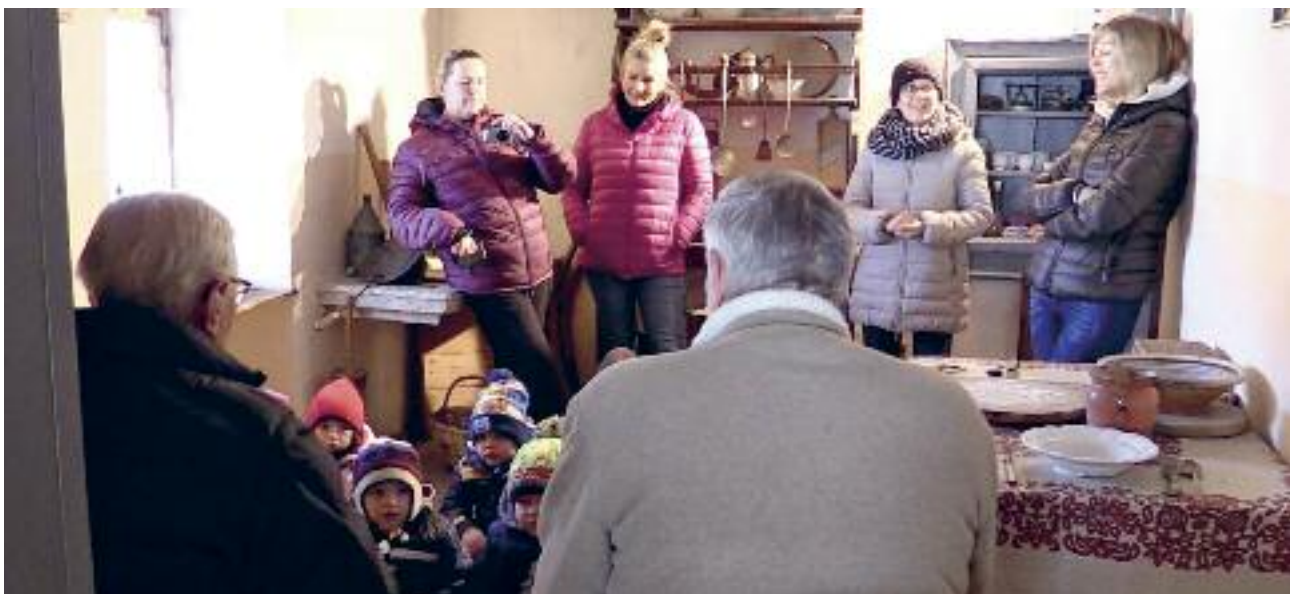
I bambini e le maestre delle scuole dell'infanzia di Nosellari e Luserna, Istituto Comprensivo FLL, svolgono assieme alcune attività scolastiche legate anche alla lingua e alla cultura cimbra

Diese Aufwertungstätigkeiten der sprachlichen Spezifität werden in den Schulen durchgeführt, auf verschiedene und evolutive Weise und immer auf der Suche nach organisatorischen und operativen Verbesserungen. Dabei sollen auch das Zimbrische Kulturinstitut, die „Magnifica Comunità“ und die Gemeinden helfen. So kann sich diese Dynamik weiter entwickeln, und ich hoffe, dass der Beitrag des Schulsprengels nützlich und konstruktiv sein kann.