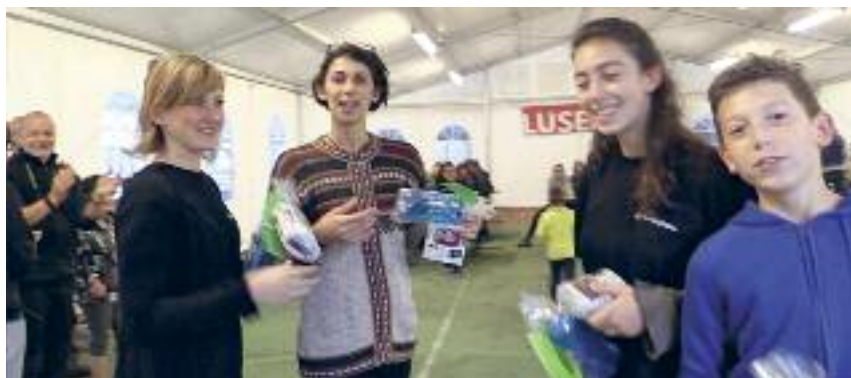
3 Di Balin