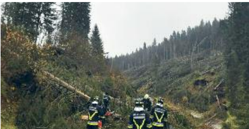
Già dal pomeriggio di domenica 28 ottobre i Vigili del Fuoco Volontari di Luserna sono intervenuti nelle emergenze di Lavarone, Val d'Assa e Luserna

Asó azpeda sa iz khent geschribet affon "Dar Fòldjo" vo disan summar, dar Kamou hatt geschafft dar Trentino Sviluppo SpA zo süacha nã bia ma magat gem mearar vèrt in allz daz sèll boda ågeat in haüsar boda soin atz Lusérn, asó magatma gem näüga arbat zo stiana nã disan haüsar,