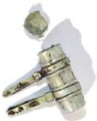
Bossolo contenitore del messaggio

ciò che quel grande conflitto ha lasciato nelle memorie, soprattutto nelle memorie familiari e, sul nostro territorio, nel terreno, nei boschi, sui pascoli e sulle alture. Molte, nel corso dell'estate trascorsa, sono state le iniziative che ci hanno visto impegnati. Per quanto mi riguarda, due mi hanno particolarmente coinvolto: l'allestimento della mostra L'ultima trincea , a Maso Spilzi, e l'allestimento della mostra Anche l'onore è perduto , al municipio di Lavarone. Due percorsi agganciati alla linea del tempo che mi sembra siano serviti a ripercorrere e a rivivere passo dopo passo ciò che quel grande conflitto ha rappresentato per le nostre comunità, un modo per fissa-