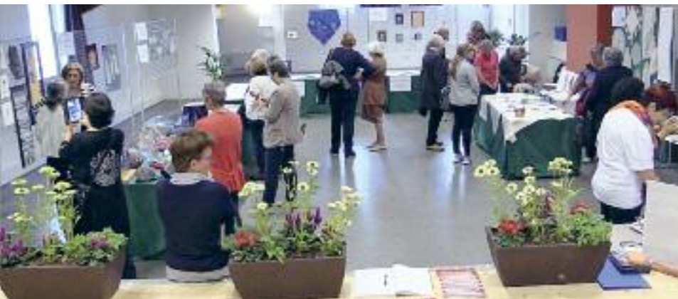
Mostra di merletti a fuselli al Festival

Daz letz bèttar von sunta hatt nèt augehaltet in Festival, ma saitze lai spostârt in tendù von Pön. Di khindar hâm genump toal in an konkurso vo disenjo, nützante di ordenje boda khemmen genützt zo khnöppla, pitt dise hâmsa gelekk panândar menndla un ândre sachandar vo fantasia, ummaz von disan menndla bart si-char khemmen di "mascotte" von Festival. In tages di bèrkstatt zo macha an armpentle gekhnöppl hatt inngevânk ploaz khindar un zèrte soinse lai inngeschribet in khnöppl kurs von Kulturinstitut