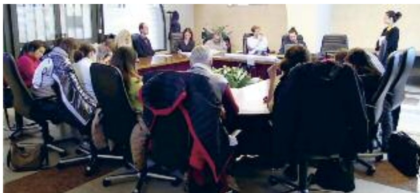
Assieme al Cimbro anche il Mocheno ai corsi IALM di Pergine

Se durante la preparazione del corso c’erano stati alcuni timori che non si raggiungesse un numero minimo di iscritti, ora possiamo dire che erano infondati: solo per la parte cimbra hanno partecipato e concluso il corso ben 17 iscritti. Il bilancio, quindi, è