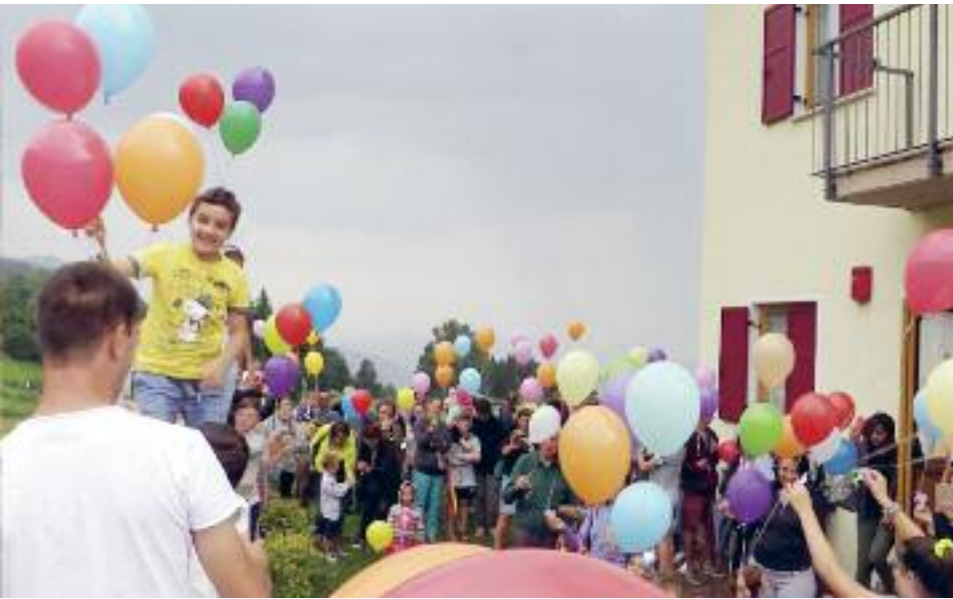
Colonia cimbra 2018