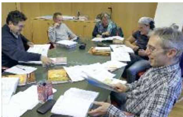
Ogni anno il Kulturinstitut organizza corsi di cimbro di livello avanzato e base al quale sempre più persone, anche da fuori provincia, partecipano con entusiasmo