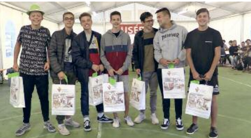
1 Putzen di Zehn