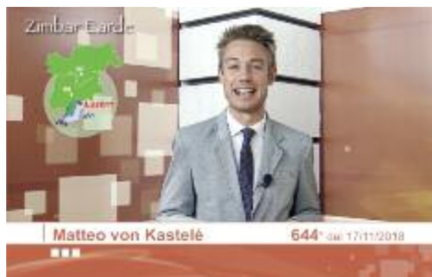
Giunto alla 650ª puntata, il TG Cimbro Zimbar Earde nel 2018 è andato in onda non solo su Trentinotv e TML ma anche su TVA Vicenza. Tutte le puntate sono reperibili sul canale youtube dell'Istituto KIL Redatziong