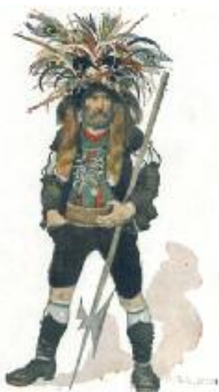
Saltaro dell'800 con il suo costume tipico

fu dotata di un curato. A suo ricordo la legna per la canonica era più che sufficiente per tutto l'inverno, ancor quando il paese contava solamente 50 famiglie. Ora che le famiglie erano aumentate fino a raggiungere il numero di 118 unità era giunto il momento di modificare tale consuetudine.