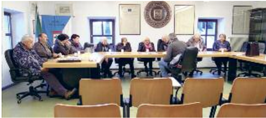
Ogni anno il Comune di Luserna propone i Corsi dell'Università della Terza età

Trentino Sviluppo SpA hat im Namen der Gemeinde Lusern das Verfahren für die Beauftragung eines Beratungsunternehmens aktiviert, um das Potenzial des Gebiets der Gemeinde Lusern zu ermitteln. Auf der Grundlage des zu erstellenden Entwicklungsplans wird erwartet, dass die