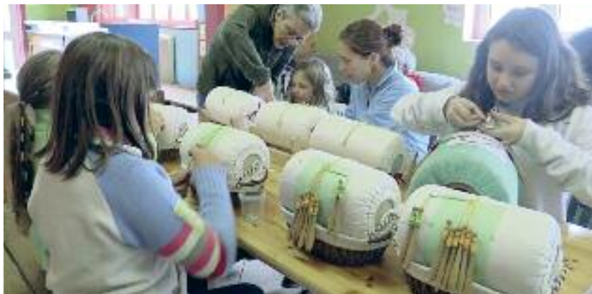
Corso di tombolo per bambini durante il festival

Il brutto tempo sicuramente non ci ha aiutato, ma la soddisfazione espressa dalle espositrici e dalle maestre merlettaie anche di associazioni austriache, i commenti più che positivi dei visitatori della mostra e quelli esternati sui social ci hanno dimostrato il successo dell'iniziativa e ci spronano a lavorare con grande impegno in prospettiva della seconda edizione del Lusérn Khnöpplspitz Fèstival - Festival del merletto.