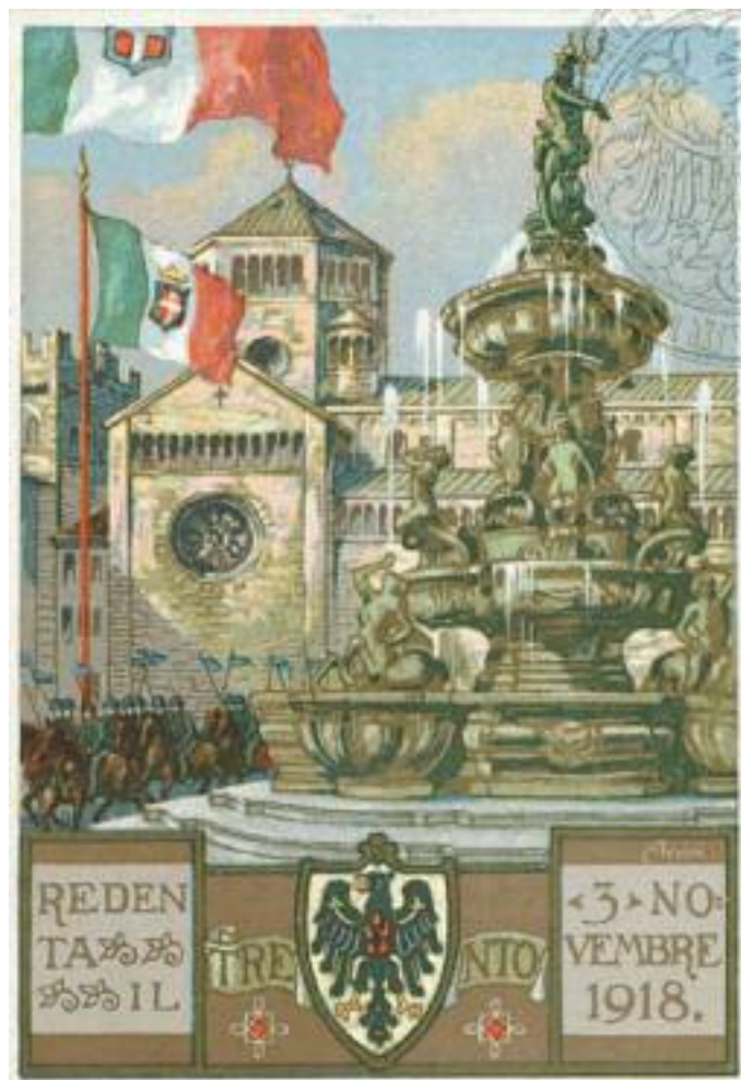
1918 - Cartolina Trento italiana

Aus der Reise dieser armen Taube, die vom Kurs abkam und auf einen Steinhaufen vom Pasubio fiel, scheint es mir, dass man die tragische Parabel von diesem sinnlosen Krieg allegorisch sehen kann. Damit ist der hundertjährige Jahrestag vorbei. Wir werden nicht mehr über diesen Tag sprechen, aber sicher noch über den Großen Krieg. Denn jene Ereignisse und jene Dramen werden bei der Erinnerung und bei unserer Geschichte bleiben.