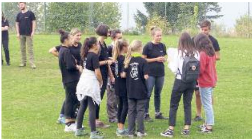
Al campo sportivo per la partenza

Bar hån gesek ke di sèlln boda nèt khånen lusérnesch o soin gelånk zo venna di börtar un zo macha verte 'z spil.