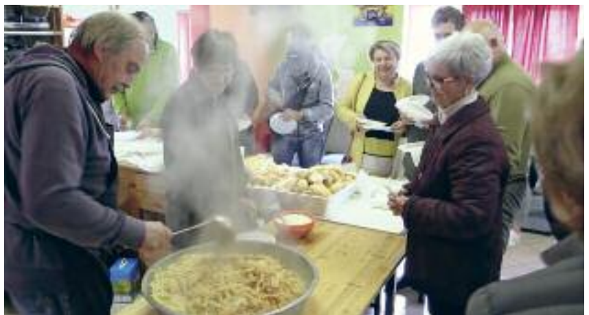
Pastasciutta per Santa Giustina

bri del nostro direttivo pur non abitando quotidianamente a Luserna sono stati presenti manifestando interesse e soddisfazione, creando una silloge fra lavoro di squadra e efficienza. Da subito abbiamo sottoscritto l'appartenenza all'Unione Nazionale delle Pro Loco d'Italia UNPLI, appoggiandoci alla sede di Trento dotata di un team pronto, disponibilissimo e professionale a cui vanno i nostri più sinceri ringraziamenti.