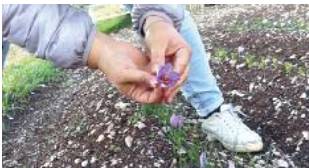
Mentre arriva a compimento la sistemazione dei terrazzamenti di Luserna, l'iniziativa dei privati trova terreno fertile per alcune colture come lo zafferano