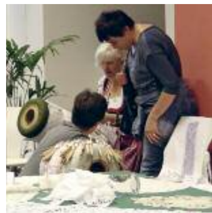
Merlettaie al lavoro durante il Festival