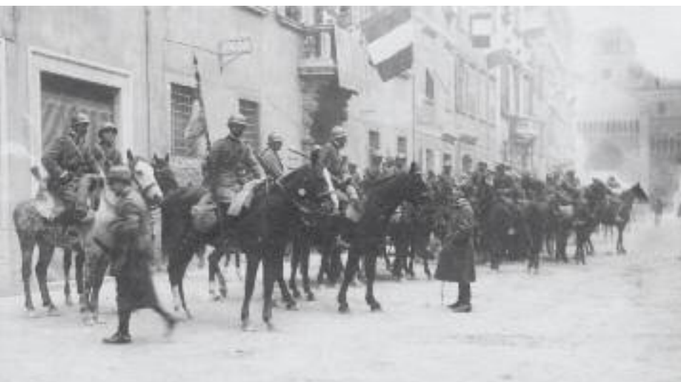
3 novembre 1918. Truppe italiane in Via Belenzani a Trento

Si concludono gli eventi commemorativi. Ma di Grande Guerra si parlerà ancora. Esattamente cent'anni fa, proprio come og-