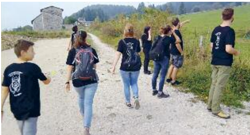
Momenti di caccia al tesoro