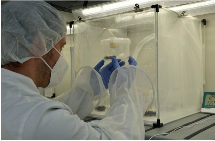
Der auzigbèrk va de kloa' bèsp Ganaspis brasiliensis .

De Ganaspis brasiliensis bart kemmen praucht en Trentin nèt lai en de zbelva platz va vert, ober en òndera òchta aa. De platz tschèrlt sai' de sèlln bou as s hòt mear acker va kloa' oubest: gor secksa platz sai' en Valzegu'; oàn ist en Panait ont oàn ist prope en Bersntol. Derzua, òndera regionen sai' enteressart en doi projekt: de Autonome Provinz va Poazn, de Lombardia, der Veneto, der Piemonte, de Valle d'Aosta, de Emilia Romagna, de Toscana, de Campania, de Puglia ont de Sicilia.