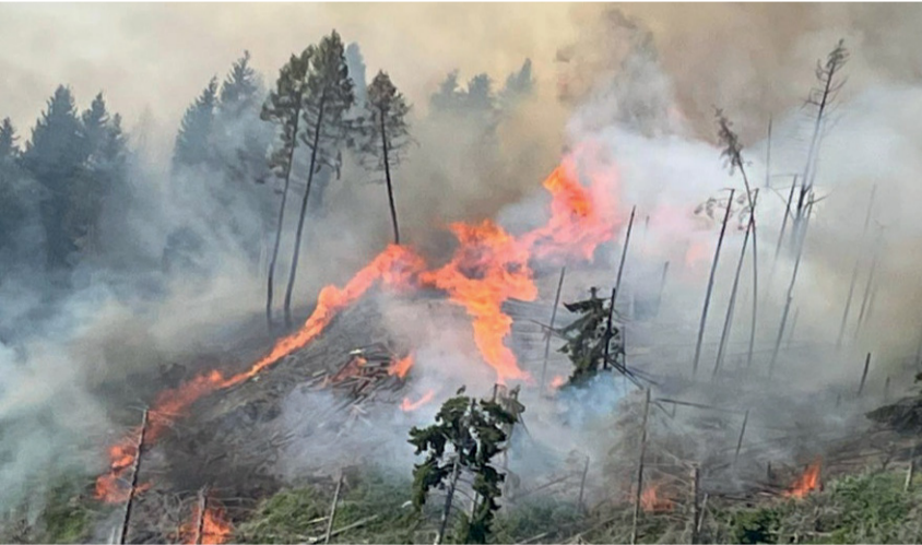
S vaier van vourder vraita en bòlt nem en de Panarotta.

En vourder vraita um drai nomitto hòt se u'kentn a vaier ka de Panarotta, bea'ne untu Malga Granda, nem en bou as de struktun van ski riven. En bea'ne zait s vaier hòt se vergreasert, vern bòrm bètter ont ver vil pàm krònka vern bostrico. An earstn elicottero van pompiarn ist Schubet kemmen asn plòtz. Dora, ist kemmen aa an Canadair, as ist oàn van bichtegestn instrumentn praucht ver za oleschn de vaier en de balder. Der Canadair hòt zboa stòrcha motorn ont ist guat za vòssn finz mear as seckstaunt liter bòsser en bea'ne zait. Er nidert se nem en bòsser lonksom (130 kilometer as de stunn) ont vòsst s bòsser a'ne hòltn se au. Ver za nemmen s bòsser ver za oleschn s vaier ka de Panarotta, der Canadair ist gòngen kan sea va Caldonazzo: de barche hom gamiast òlla vort gea.