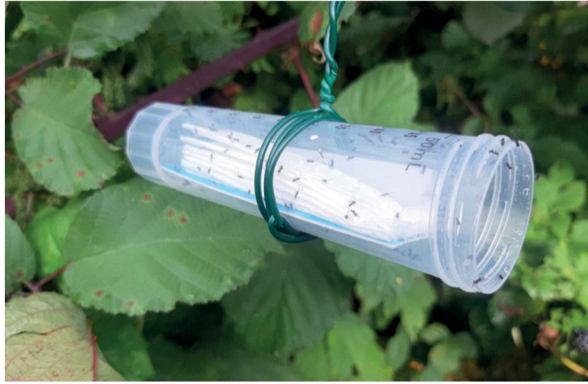
Asou kemmen ausgalòk de kloa'na bèspn Ganaspis brasiliensis .